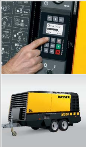
*עבור יצוא מחוץ ל-EU