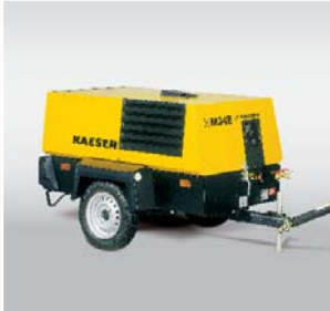
*עבור יצוא מחוץ ל-EU