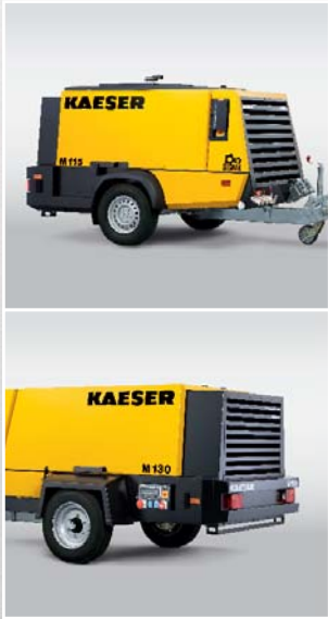
*עבור יצוא מחוץ ל-EU