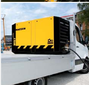
*עבור יצוא מחוץ ל-EU